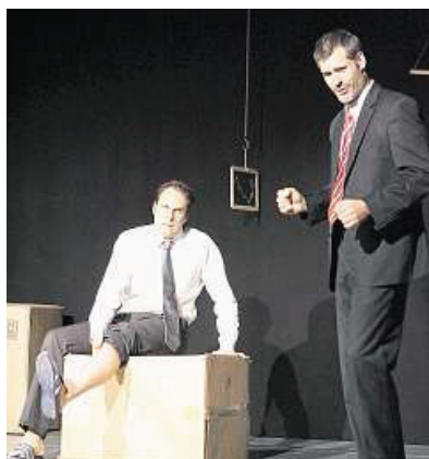
Wenn ein Beinbruch die Karriere bedroht: Manchmal können auch Ärzte nicht wie von Managern gewünscht helfen.